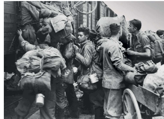
Soldati italiani, inconsapevoli del loro destino, salgono sul treno che li porterà verso i lager del Terzo Reich.