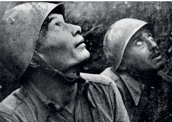
Cefalonia, settembre 1943 soldati della Divisione "Acqui".

Cefalonia, Corfù, Kos, Leros, Dubrovnik, Korça, Kuç-Sarandë-Capo Limione, Sinj-Trilj, Hildesheim, Treuenbrietzen, Kuźnica Żelichowska (Shelkow), Oradour-sur-Glane, Domenikon.